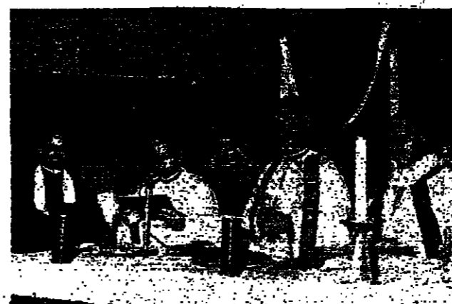
الابناني بولس ثاوري يريش الصلاة